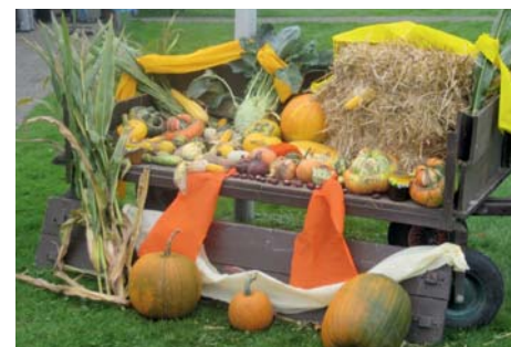
Erntedankfest im Kgv. „Im Erlengrund“.