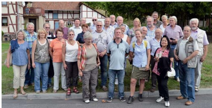
Mitglieder des BzV. Ennepe-Ruhr auf der Schulungsfahrt nach Schönhagen.

„Dreschflegel“ in Schönhagen. Pünktlich um 8.00 Uhr ging die Fahrt bei schönem Wetter in Gelsberg los. Die Route führte uns durch vier Bundesländer (NRW, Hessen, Niedersachsen, Thüringen) nach Schönhagen.