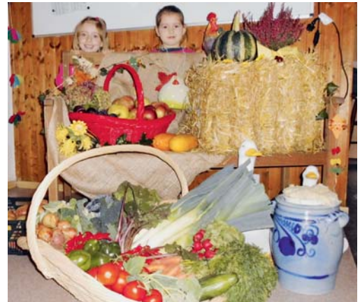
Erntedankfest im Kgv. „Am Schellenberg“.

Für Speis' und Trank war bestens gesorgt. Und auch an Spezialitäten hatte man gedacht. Für Suppenfreunde war die deftige Kartoffelsuppe genau das Richtige – oder vielleicht doch lieber die mindes-