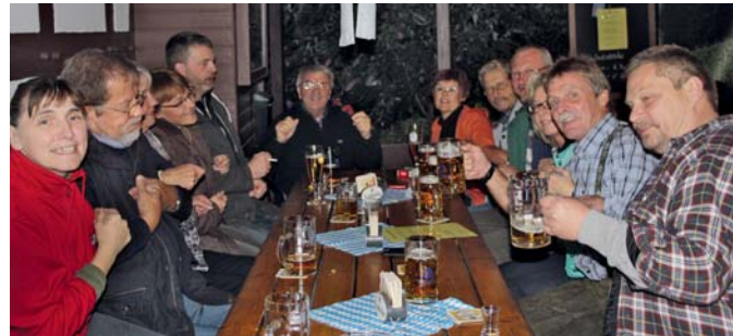
Die lustigen Gartenfreunde des Kgv. „Am Steinbrink“ bei ihrem bayerischen Oktoberfest.