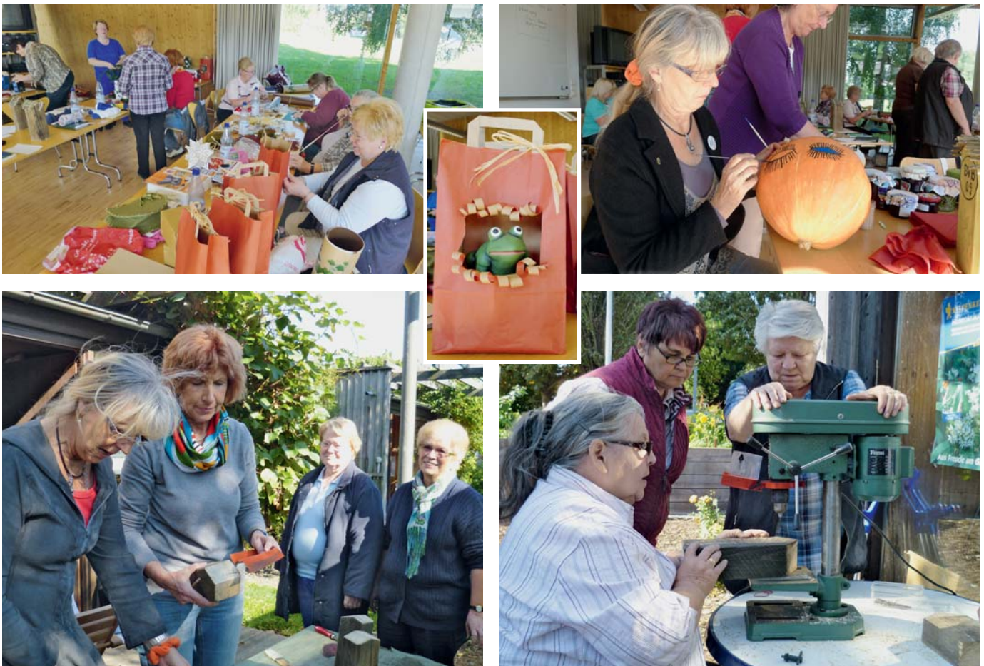
Es wurde gekocht, geklebt, gemalt, gehämmert, geschraubt und gebohrt, so entstanden – individuelle Gartenaccessoires, Nisthilfen und leckere Marmeladen. Und das alles für einen guten Zweck.