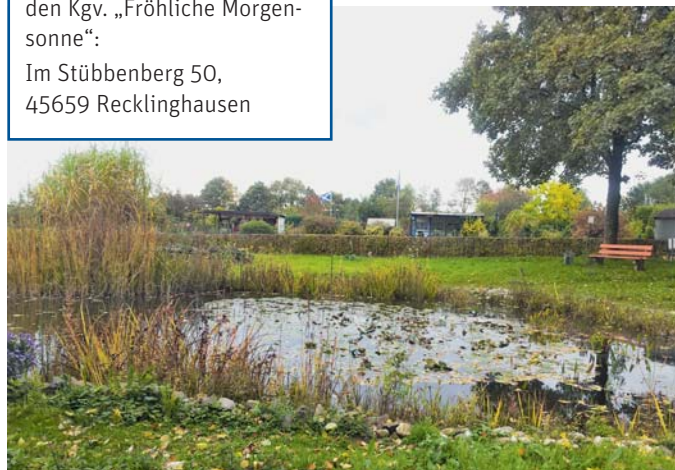
Naturerlebnis pur am Teich im Kgv. „Fröhliche Morgensonne“.