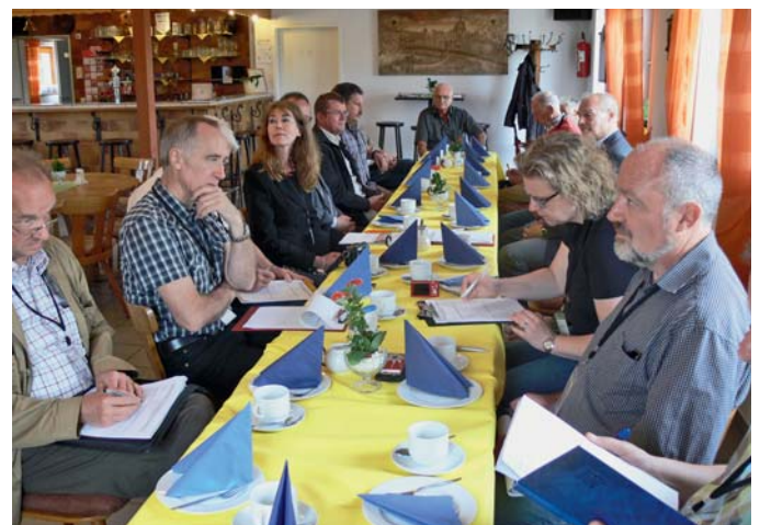
Gastlicher Empfang: Die Kommission wurde überall toll bewirtet.