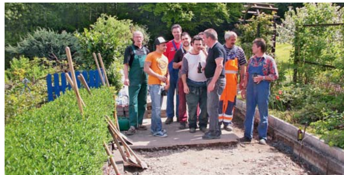
Gartenbau-Verein „Haspe-Kipper“: Ein neuer Weg muss her, komme, was da wolle. Hier die fleißigen Pflasterer.

Samstag, 10. Mai, 10.00 Uhr: „Kompostparty“, Ort: Kgv. „Am Südhang“