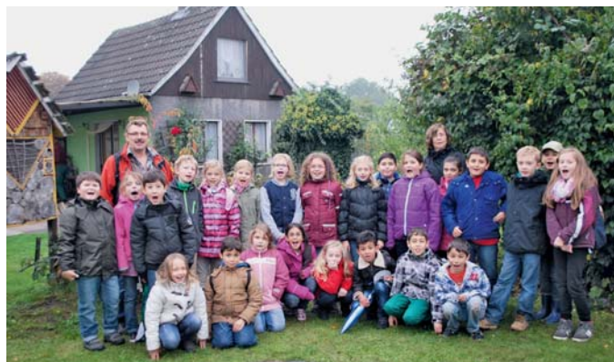
Gruppenfoto der Schüler der Grundschule „Am Busch“ bei ihrem Natur-Tag im Kgv. „Nord“.

Im Herbst ist Erntezeit. Kartoffeln, die im Frühjahr gepflanzt wurden, werden im Herbst ausgebuddelt und am Lagerfeuer als Folienkartoffeln zubereitet. Bis jedoch die Kinder an die Schuppen dürfen, müssen sie einiges über die Gartenwelt kennenlernen.