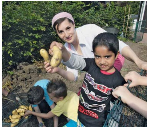
Erntezeit im Kgv. „Am Schellenberg“: Wow! So viele, so schöne Kartoffeln!

Da ging ein Raunen durch die Menge, und ein Staunen legte sich auf die Gesichter – soooo viele, soooo dicke Kartoffeln, das hatten die meisten der Kinder so noch nie zuvor in ihrem Leben gesehen. Danach wurden auch noch Zwiebeln und Wirsing geerntet. Zum Schluss halfen alle mit, die Ernte im Bollerwagen