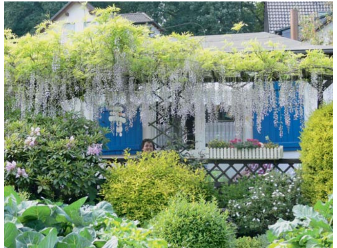
Die Goldmedaille ging an den GV. „Lütgendortmund Nord“ in Dortmund.