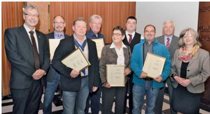
Siegerehrung für die Gewinner des Anlagenwettbewerbs des Stadtverbands Bochum im Rathaus. Hier die Gewinner der 1. Plätze.