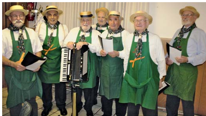
Dem Nappenchor haben die Bottroper, und auch die überörtlichen Vereine, viele schöne Stunden zu verdanken.

Und solche Kameraden hatten sich Anno 1983 im Kgv. „Nappenfeld“ gedacht: „Wir lassen die schöne alte Zeit der vergangenen Jahre wieder aufleben.“ Sie gründeten den Nap-