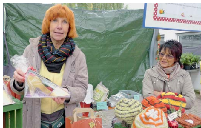
Mit einem eigenen Informations- und Verkaufsstand waren die Frauenberaterinnen der Bezirks-/Stadtverbände am Apfeltag in der Baumschule Giesebrecht mit dabei.