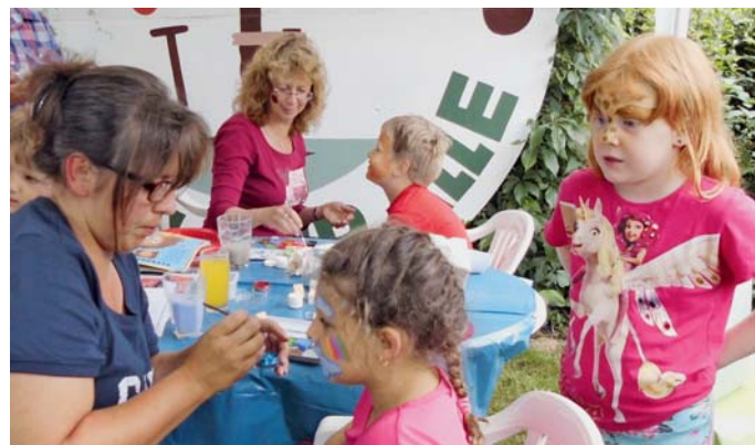
Auf dem Kinder- und Gartenfest des Kgv. „Am Schellenberg“ gab es Kinderschminken für die Kleinen.

Mit Bad Zwischenahn als Reiseziel hatten wir – zudem auch noch bei gutem Wetter – einen echten „Treff“ gelandet. Im dortigen Park der Gärten konnten wir uns in insgesamt 40 Themengärten auf etwa