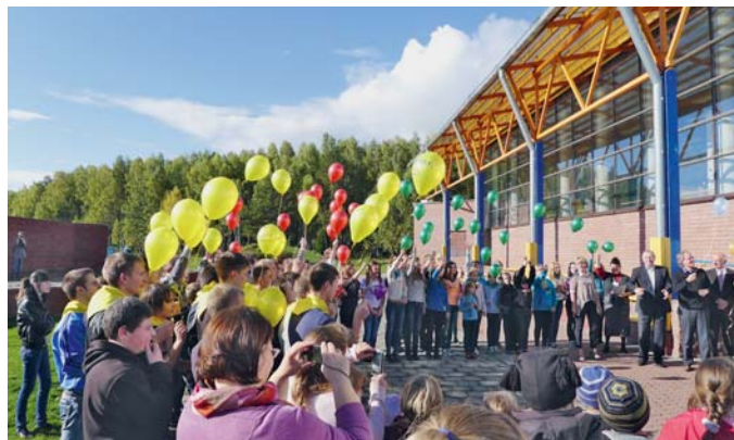
Zum 19. Jahrestag von NADESHDA eine Geburtstagsfeier mit den Kindern – Luftballons steigen in den Himmel.