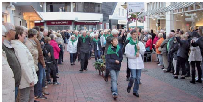
Die Stadt Emsdetten feiert in diesem Jahr „75 Jahre Stadtrechte“. Beim Festumzug waren auch die Kleingärtner mit von der Partie.

Wie jedes Jahr war im Juni eine Kommission zur Gartenbewertung angereist. Die Gewinner im Parzellenwettbewerb werden sofort bekannt gegeben. Allerdings bleibt es ein großes Geheimnis, welche Platzierungen im Anlagenwettbewerb