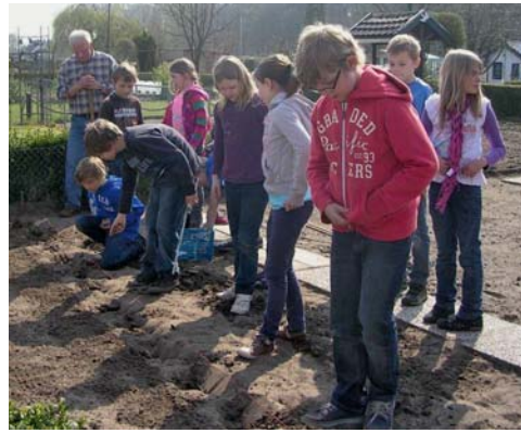
Kinder des 4. Jahrgangs der Grundschule Südeschule/Konradschule pflanzten Kartoffeln im Rahmen des Projekts „Garten erleben“ des Kgv. „Heidacker“.