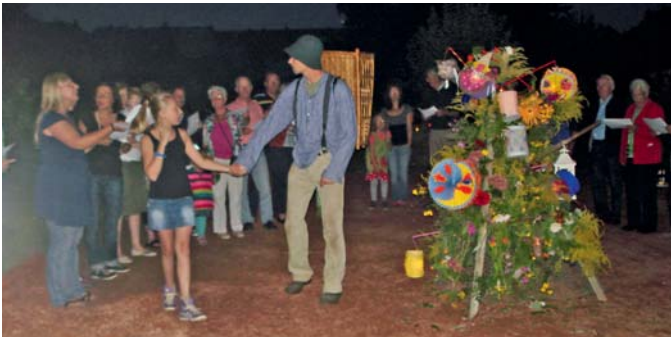
Am 7. September feierte der Kgv. „Grüner Krug“ sein 80-jähriges Bestehen und das Lambertusfest mit Blumenpyramide und Buer.

den zu füllen. Die offizielle Anerkennung als Schrebergarten erfolgte dann 1933. Lag die Sandgrube seinerzeit am Stadtrand von Münster, ist sie nun im Südviertel eingebettet und gehört zu den Anlagen, die der Innenstadt am nächsten liegen.