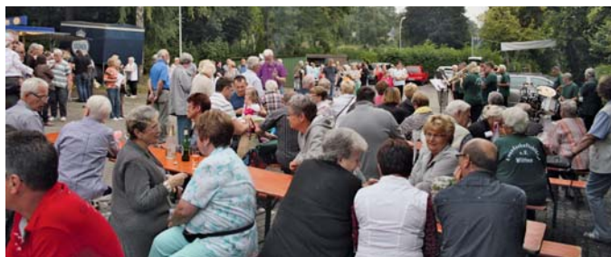
Sommerfest des Kgv. „Ruhrblick Heven“ auf dem großen Parkplatz und im Vereinsheim.

Die Wittener Showkapelle „Los Spektakoloss“ gab zwischendurch ein Gastspiel und unterhielt die gut