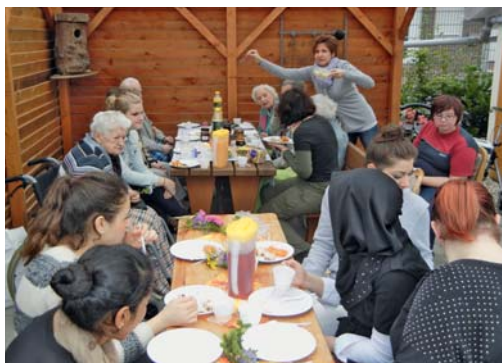
Erstmalig fand im Mehrgenerationengarten des Kgv. „Ontario“ ein Seniorenfrühstück statt. Die Senioren haben sich über das leckere Frühstück gefreut, und die Schüler der Albert-Schweitzer-Schule waren zufrieden, dass ihre Arbeit so gut angekommen ist.