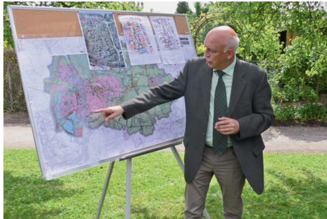
Die Kleingartenanlagen hatten sich gut vorbereitet und präsentierten sich im besten Licht.

Die Kleingärtner werden sich ihrer Aufgabe für das Stadtgrün, für das Stadtklima und die Stadtgesellschaft immer bewusster, sodass sie sich kontinuierlich fortbilden und zu ökologischen und gesellschaftlichen Spezialisten werden.