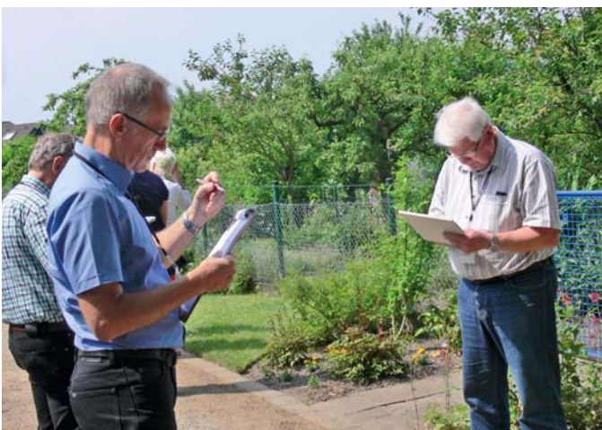
Die Bewertungskommission vor Ort bei der Arbeit.

Die gesellschaftliche Funktion der Kleingartenanlagen macht sich heute daran fest, dass die Kleingärtnervereine sich im Sinne sozialer Nachhaltigkeit bemühen, alle Generationen, Familien und Alleinstehende, eine Vielfalt an