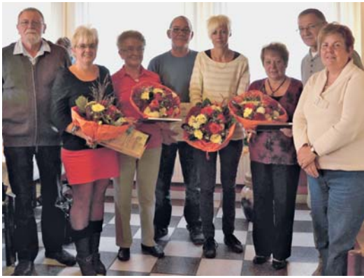
Ehrung für langjährige Mitgliedschaften und besondere Verdienste im Kgv. „Recklinghausen I“ durch den Bezirksverband.