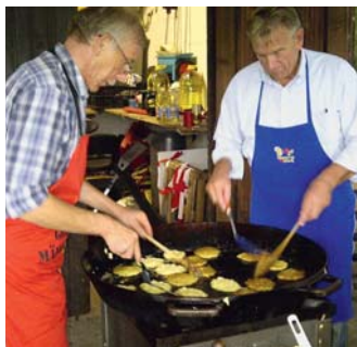
Beim Kleingärtner-Kartoffelball im Kgv. „Sendenhorst“ wurden rund 600 Reibekuchen „verputzt“.

Zwei kleine Zelte und das gesamte Vereinsheim standen mit Sitzgelegenheiten zur Verfügung, da der Wetterbericht einige Schauer erwarten ließ!