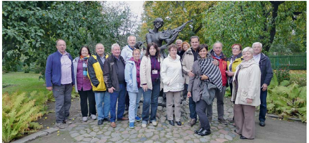
Gartenfreunde aus Westfalen-Lippe und Belarus im Museums-Garten des Marc Chagall-Hauses

Der umweltverträgliche Anbau von Obst und Gemüse sichert die Versorgung der Kinder mit frischen Gartenprodukten, angebaut in ei-