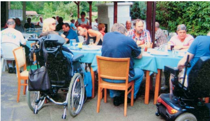
Integration im Kgv. „Kuhkamp“: Zusammen mit jungen Menschen des Detmolder Vereins „Jüngere Wohnpflege“ feierten die Gartenfreunde ihr diesjähriges Sommerfest.

„Das diesjährige Sommerfest des Kgv. ‚Kuhkamp‘ war wieder ein vol-