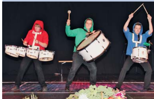
Das Trommler-Trio „Kolping Drumcorps“.

Anschließend konnte zum gemütlichen Teil des Abends übergegangen werden. Musikalisch gab das „Kol-