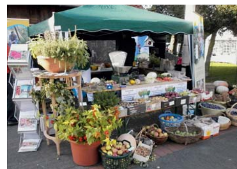
Der Stand der Vereine Kgv. „Kurenholt“ und Kgv. „Drostenholt“ auf dem Kartoffelfest in Oelde.

Fast schon traditionell ist der „Kartoffelball“ im Kleingärtner-Verein „Sendenhorst Zur Rose“. Vorab hatten die Mitglieder am Freitag 2 1/2 Zentner Kartoffeln geschält und 15 Torten und Kuchen gebacken, da sich sowohl eine große Abordnung der Feuerwehr als auch der KFD (Katholische Frauengemeinschaft Deutschland) angemeldet hatten.