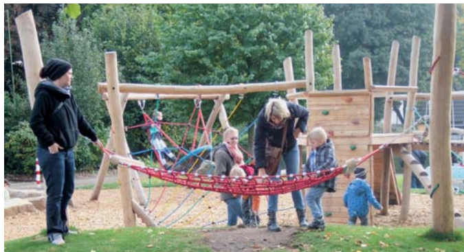
Interessierte neue Spielplatz-Nutzer im Kgv. „Dr. Schreiber“.

Zur Eröffnung sangen und erzählten die Kita-Kinder der AWO eine schöne Geschichte über den Herbst. Danach wurden erst einmal alle Spielplatz-Geräte ausprobiert. Der neue Spielplatz stößt auf großes Interesse in der Bevölkerung. Er wird nicht nur von den Kindern der Kleingärtner genutzt, sondern wird auch von Kindern aus dem